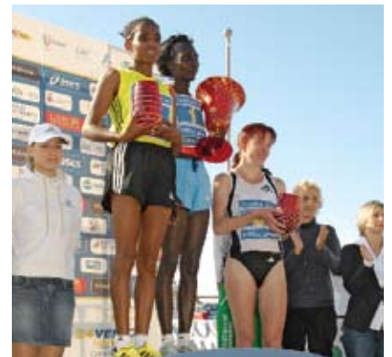
MUJERES PRIMERO A diferencia de otros maratones, las mujeres élite tuvieron preferencia al salir.