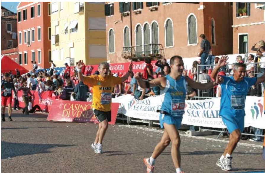
CONVOCATORIA AVASALLANTE El número máximo de participantes fue alcanzado en tiempo récord y las inscripciones se cerraron en 6,500 ante una demanda de 8,500 corredores.

ares, sino a todos aquellos que de alguna manera indirectamente forman parte del éxito de la manifestación: el público.