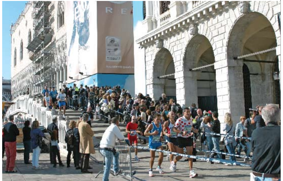
LA ÚLTIMA FASE El recorrido comprende los sitios más emblemáticos de Venecia: Canal Grande, Plaza San Marco, Punta de la Dogana y la Basílica de San Marco, entre otros.

Finalmente llegamos al Puente de la Libertad, única vía que hasta ahora que conecta Venecia con el continente. Los 4 km más duros para los corredores pero que entrega como promesa a quien lo termina, regalar a la mágica Venecia.