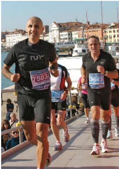
RETO MAYOR Los 42 K de Venecia comprenden pasar por 14 puentes con hermosas vistas.