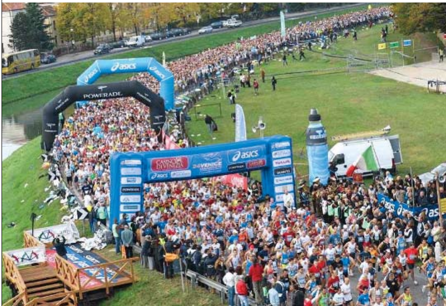
CON SUS PROPIAS CUALIDADES No será el que mayor número de participantes tiene ni el más popular del planeta, pero es dueño del final más espectacular del orbe.