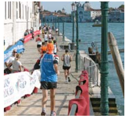
SIN PRECEDENTES Los habitantes de Venecia y pueblos aledaños salen a apoyar a los corredores.

El recorrido en tierra firme quedó engalanado con las características que en