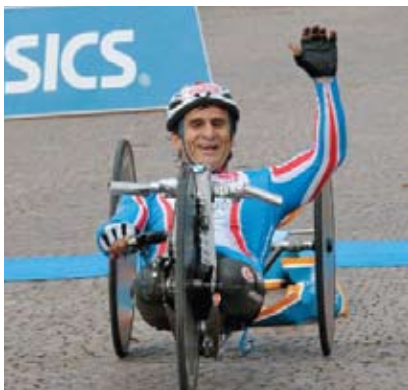
HÉROE DE TODOS Alex Zanardi obtuvo su primera victoria en su hand-bike .