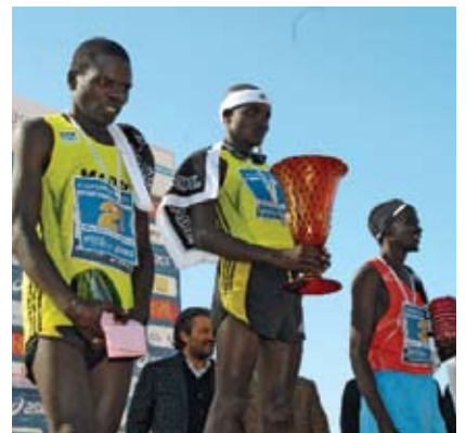
KENIA ARRASA Como si se tratara de una tradición, los kenianos se apoderaron de los primeros sitios.

el transcurso de los años lo han hecho famoso y reconocido por su largo trayecto en la Riviera del Brenta, una vista muy sugestiva y que se presenta como aperitivo para lo que está por llegar.